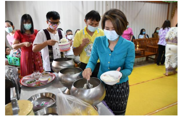
ทำบุญตักบาตรประจำปีสำนักงานสาธารณสุขจังหวัดสระแก้ว