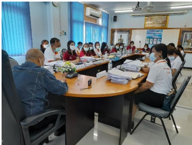
ภาพที่ ๖ ตรวจสอบภายในโดยองค์กรภายนอก