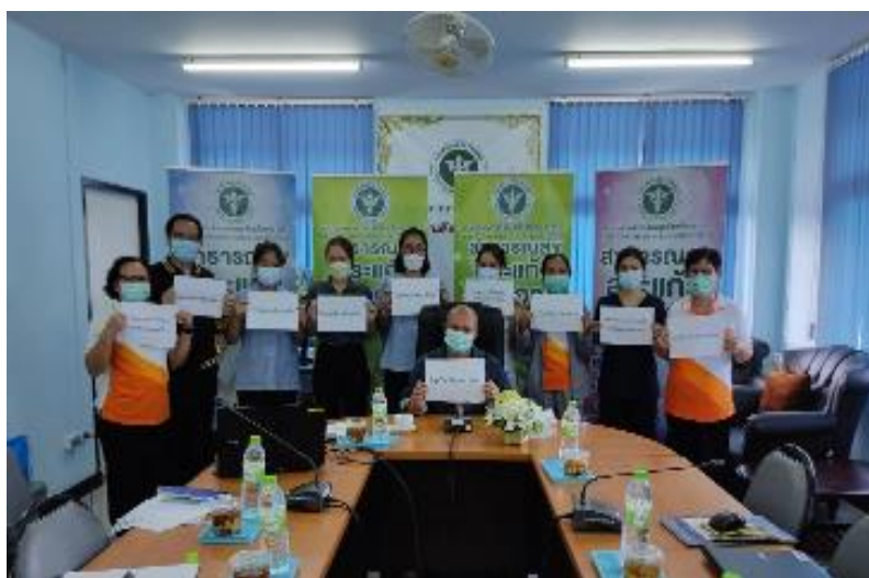
ภาพที่ ๓ ประกาศต่อต้านการทุจริตทั้งองค์กร