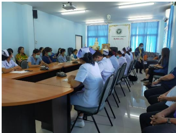
ภาพที่ ๒ อบรมคุณธรรมจริยธรรม โปร่งใส และการป้องกันผลประโยชน์ทับซ้อน