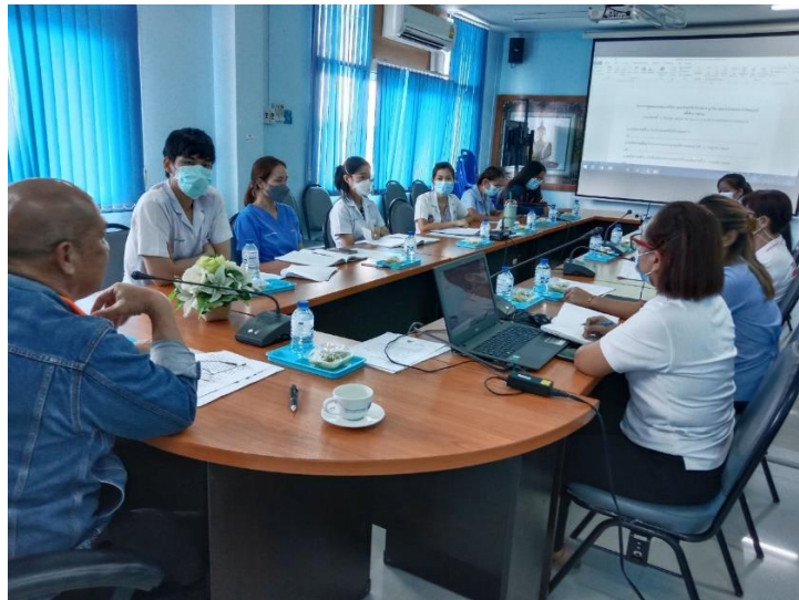
ภาพที่ ๙ ประชุมประจำเดือนสรุปผลการดำเนินงานและร่วมหาแนวทางแก้ไข