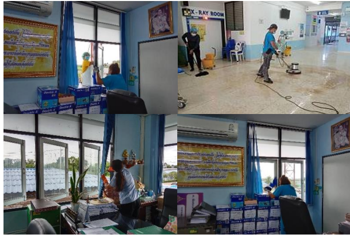
ภาพที่ ๘ จิตอาสาพัฒนาสิ่งแวดล้อมในที่ทำงาน