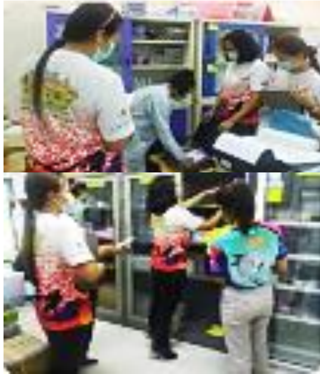
ภาพที่ 11 ตรวจสอบการรับ-จ่ายพัสดุประจำปี