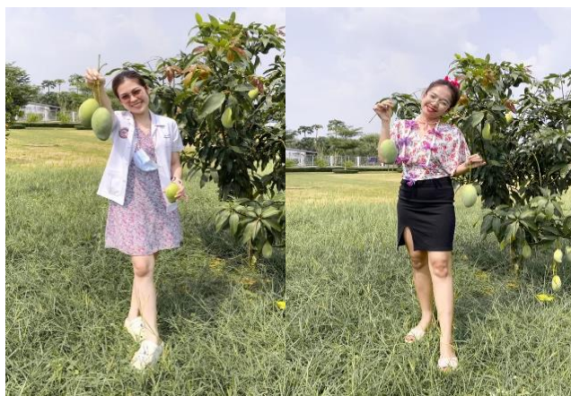
ภาพที่ ๑๐ สร้างสุขในองค์กร “แบ่งปันผลผลิต”