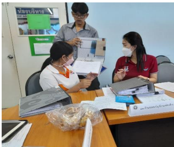
ภาพที่ ๗ ตรวจสอบภายในโดยองค์กรภายนอก