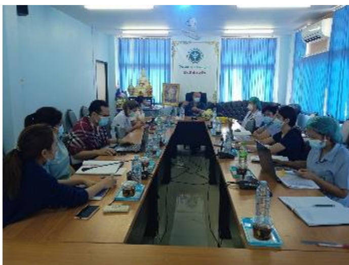
ภาพที่ ๑ อบรมคุณธรรมจริยธรรม โปร่งใส และการป้องกันผลประโยชน์ทับซ้อน