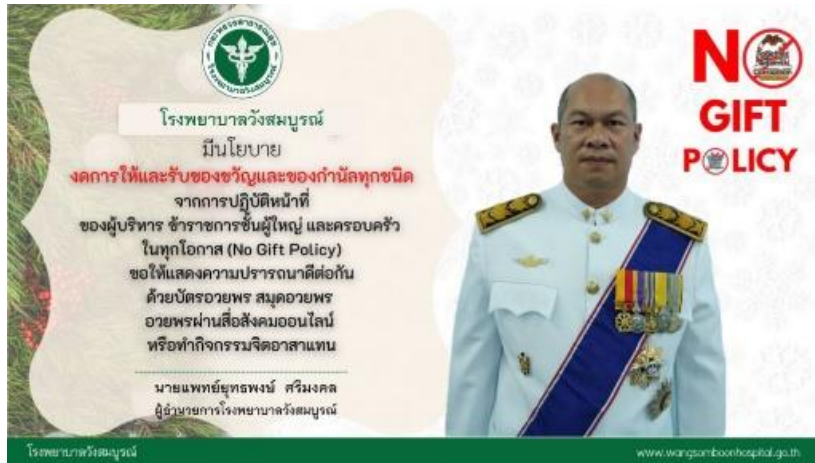
ภาพที่ ๔ ประกาศงดรับของขวัญและของกำนัล