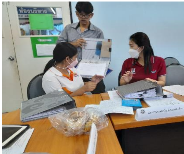
ภาพที่ ๗ ตรวจสอบภายในโดยองค์กรภายนอก