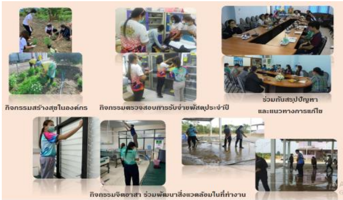
ภาพที่ ๘ กิจกรรมภายในแนวคิด จิตพอเพียงด้านทุจริต