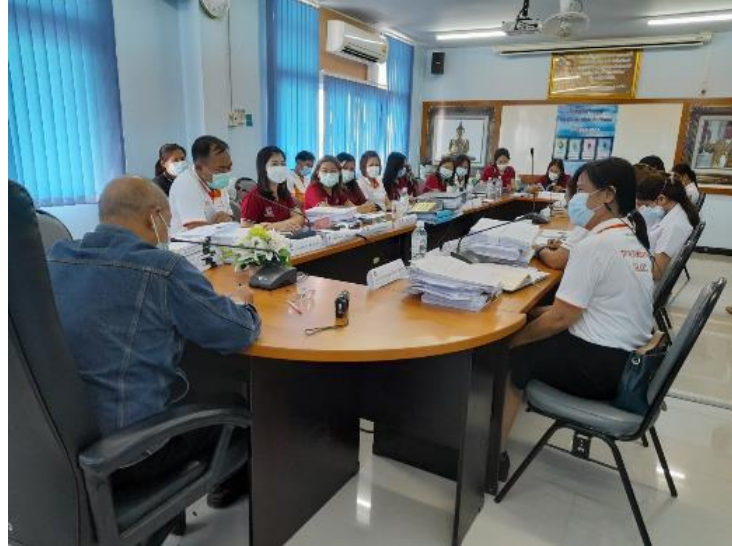
ภาพที่ ๖ ตรวจสอบภายในโดยองค์กรภายนอก